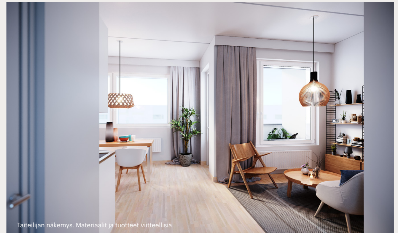
Taitelijan näkemys. Materiaalit ja tuotteet viitteellisiä

Lisähintaisten sekä erikseen tarjottujen tuotteiden hinnoissa on huomioitu hyvitykset vakiotuotteista. Tarjoukset lisä- ja muutostöistä toimitetaan sinulle hyväksyttäväksi huoneistokortin hyväksymisen yhteydessä. Voit joko hyväksyä tai hylätä esitetyt tarjoukset lisä- ja muutostöistä. Mikäli pyydät tarjouksia malliston ulkopuolisista lisä- ja muutostöistä, niin suosittelemme olemaan yhteydessä hyvissä ajoin. Fira Oy pidättää oikeuden muutoksiin liittyen lisä- ja muutostöihin.