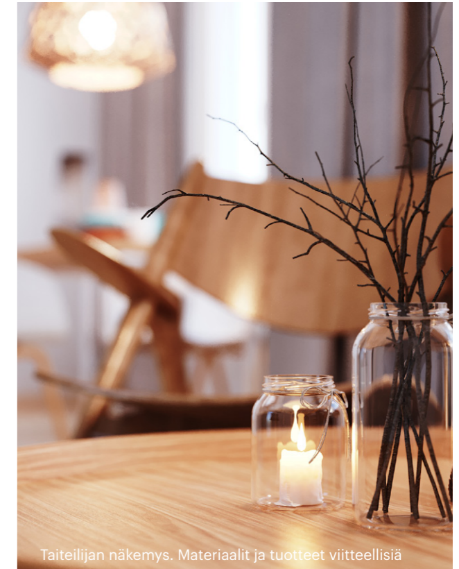
Taiteilijan näkemys. Materiaalit ja tuotteet viitteellisiä

Avaimet luovutetaan osakkaille arvioidun valmistumisajankohdan mukaisesti. Tarkemmasta aikataulusta tiedotetaan myöhemmin. Huomioithan, että kaikki asunto-osakkeeseen sekä lisä- ja muutostöihin liittyvät laskut tulee olla maksettu ennen avainten luovutusta.