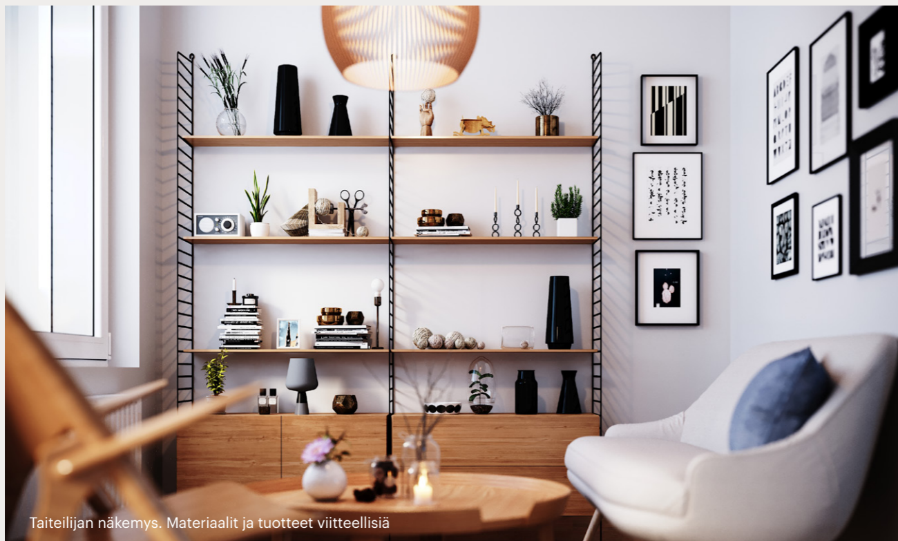
Taiteilijan näkemys. Materiaalit ja tuotteet viitteellisiä

Fira Oy suorittaa sopimuksen mukaiset takuukorjaukset. Asumista haittaavat puutteet korjataan välittömästi. Muut takuukorjaukset aloitetaan noin kahden vuoden kuluttua asuntoon muutosta. Asunto Oy kerää tiedot mahdollisista puutteista ja toimittaa ne Fira Oy:lle. Tämän jälkeen mahdolliset korjaustyöt suoritetaan keskitetysti. Eri työvaiheista tiedotetaan ennen töiden alkamista. Takuukorjauksista saat lisätietoa myöhemmin.