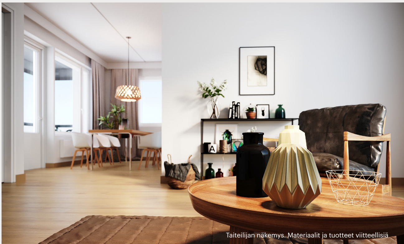
Taiteilijan näkemys. Materiaalit ja tuotteet viitteellisiä